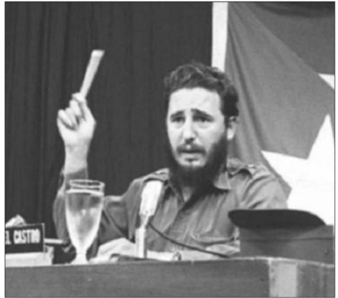
Fidel Castro comparece por CMBF-Televisión Revolución en respuesta al discurso del Presidente de Estados Unidos John F. Kennedy