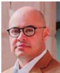
FRANCISCO MURILLO, FISCAL ZACATECAS

En medio de una crisis mediática y un amplio y sentido reclamo social, por fin, la Fiscalía General de Justicia del Estado de Zacatecas, abrió los ojos y oídos y se manifestó sobre el lamentable deceso del joven Jorge; a través de un comunicado, la Fiscalía de Francisco Murillo Ruiseco informó que existen tres líneas de investigación respecto al fallecimiento del joven preparatoriano. Por el bien de las instituciones, y ante el clamor de la sociedad zacatecana, es indispensable que conforme la ley lo permita y no se perturbe, obstruya el debido proceso, se den a conocer los resultados de sus investigaciones, para el bien y tranquilidad de todos