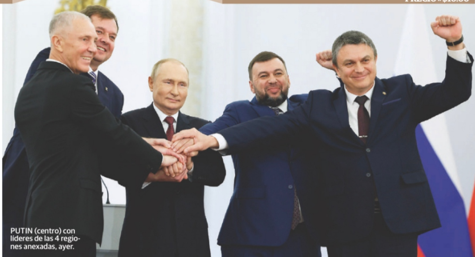
PUTIN (centro) con líderes de las 4 regiones anexadas, ayer.

● Hackeo a la Defensa es cierto, admite AMLO; minimiza temas de salud filtrados; PAN: datos demuestran que miente; Morena dice que nada lo ha doblado