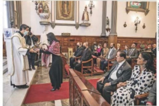
En la misa, el sacerdote destacó el liderazgo de esta casa editorial.

UNA SEMANA CON VILLA. SE CUMPLE UN SIGLO DE LA HISTÓRICA ENTREVISTA