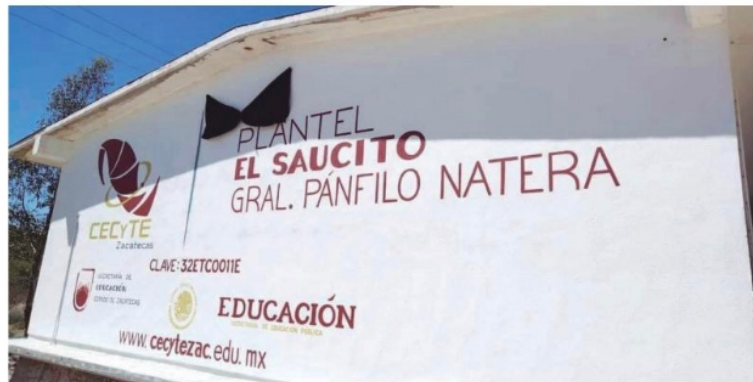
El plantel del Cecytez también está de luto, ya que ahí cursaron la preparatoria.