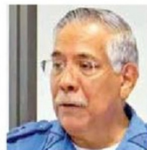
Al militar se le implica en la muerte de seis normalistas.