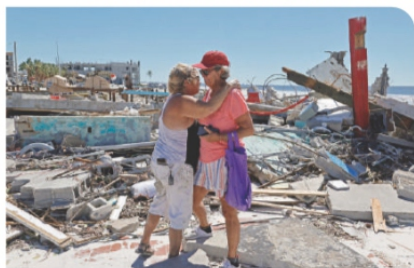
DAMNIFICADOS en la isla de Fort Myers Beach, Florida, ayer.

CORRESPONDEN A CUENTAS PÚBLICAS DE 2019 Y 2020