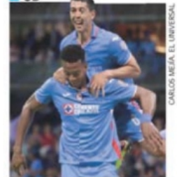
CARLOS MEJÍA, EL UNIVERSAL