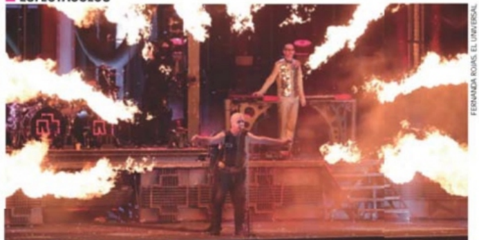
FERNANDA ROJAS, EL UNIVERSAL