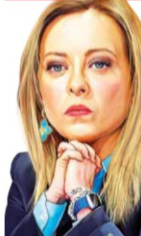
Ilustración: Jesús Sánchez