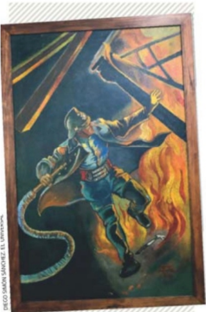
DEGO SAMÓN SÁNCHEZ, EL UNIVERSAL