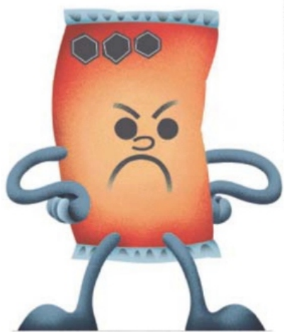
ILUSTRACIÓN DANIEL RAZO, EL UNIVERSAL

El óleo, que muestra a un vulcano combatiendo el fuego, fue rescatado de la basura y será expuesto al público en diciembre. | METRÓPOLI | A11