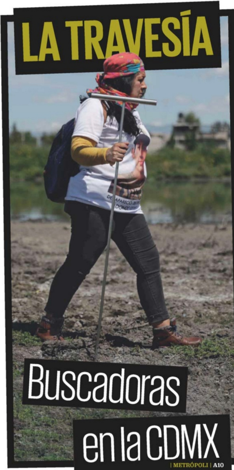
DEGO SAMÓN SÁNCHEZ, EL UNIVERSAL