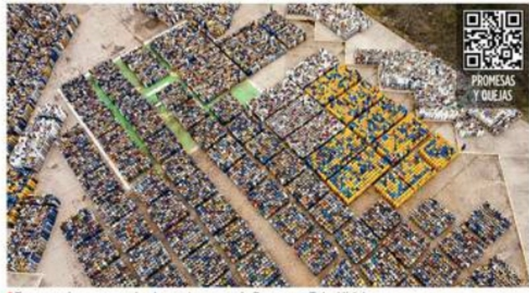
Tanques de gas arrumbados en terrenos de Pemex en Tula, Hidalgo.

Entrevistados por REFORMA, trabajadores de Gas Bienestar dijeron que laboran con incertidumbre sobre la extensión de sus contratos y aún esperan el cumplimiento de promesas como las comisiones por ventas, uniformes, alza de salarios y seguridad