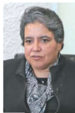
Raquel Buenrostro fue jefa del SAT durante 34 meses.

El Presidente dijo que, en breve, informará quién sustituirá a Buenrostro en el SAT.