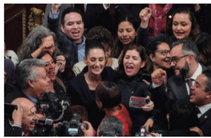
LA MANDATARIA capitalina, en el Congreso local, ayer.

VIRÓLOGOS indican que cepa H3N2 es más letal y llaman a vacunarse; ven riesgo por poca inmunidad debido a pandemia de Covid; podrían darse contagios con ambas enfermedades al mismo tiempo. pág. 11