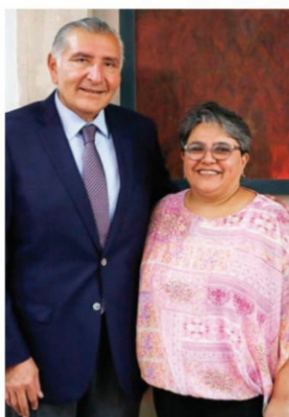
Adán Augusto, secretario de Gobernación, y Raquel Buenrostro, flamante titular de Economía.

En una apretada agenda, Raquel Buen Rostro se reunió en Pa-