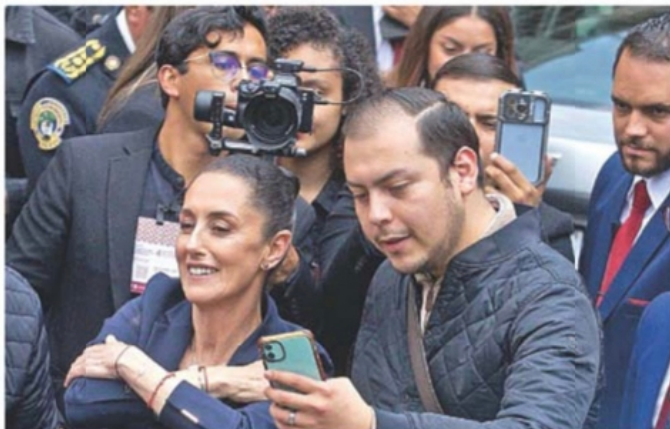
GERMÁN ESPINOSA, EL UNIVERSAL

Entre selfies, abrazos, uno que otro cuestionamiento y gritos de "¡presidenta!" de diputados morenistas, la jefa de Gobierno, Claudia Sheinbaum, rindió ayer su Cuarto Informe ante el Congreso de la Ciudad de México. Con la ausencia de cinco alcaldes de oposición y reproches de que está en campaña, la mandataria afirmó que cambió la forma de gobernar y quedó atrás la corrupción, el clasismo y el racismo. | METRÓPOLI | A9