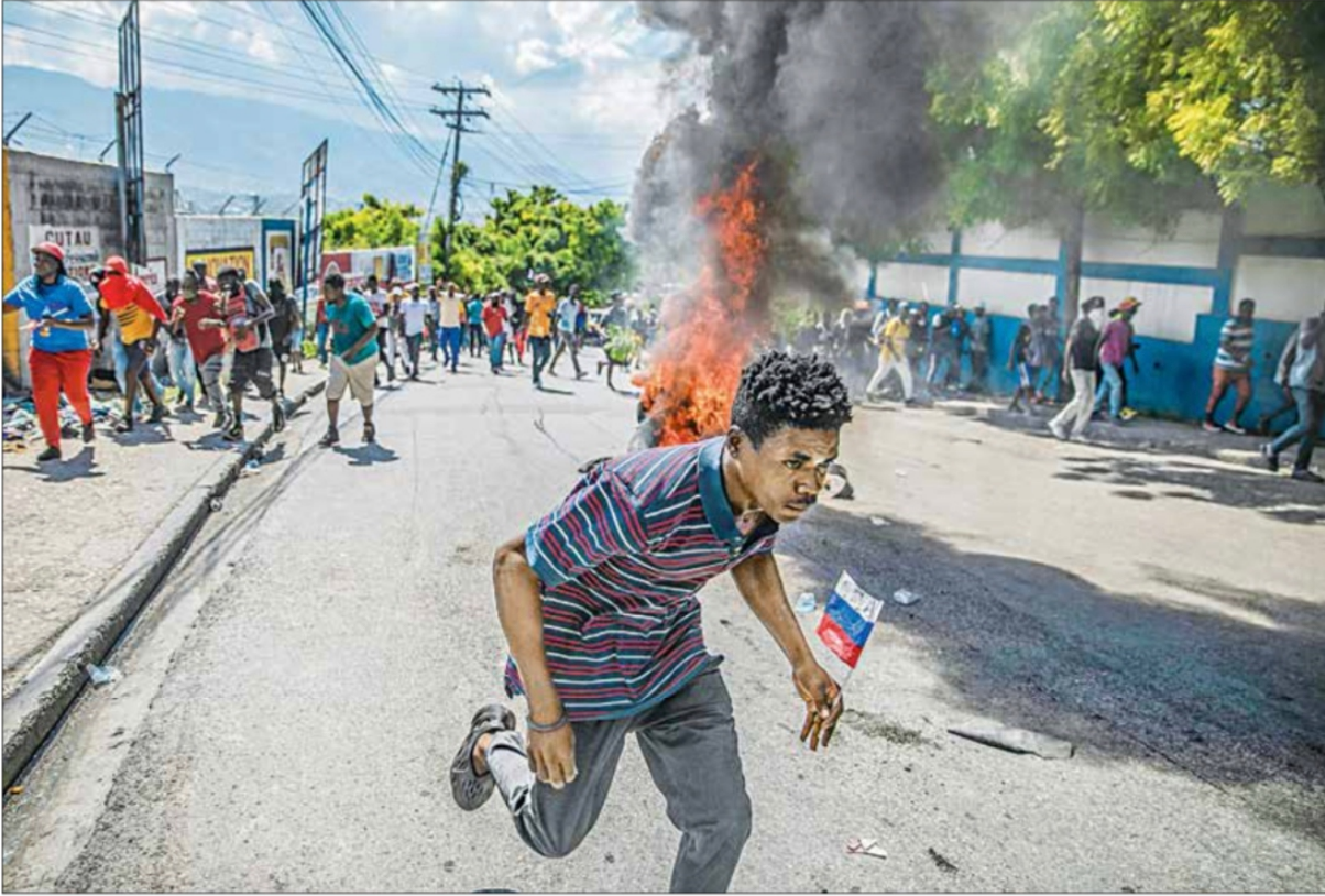
▲ Miles de haitianos salieron a las calles de Puerto Príncipe y otras ciudades para exigir la dimisión del primer ministro Ariel Henry ante el disparo en los precios de alimentos y combustibles, los cuales se han vuelto inaccesibles para la mayoría de la población.

● EU y México preparan resolución para reforzar seguridad y entrega de ayuda humanitaria