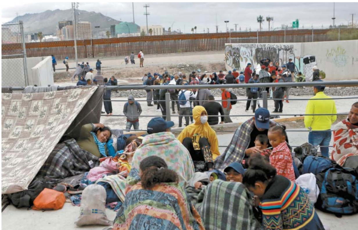
CHRISTIAN TORRES. EL UNIVERSAL

Ciudad Juárez.— Migrantes venezolanos que han sido deportados de Estados Unidos a México duermen en las calles ante la saturación de los albergues. Tras salir de su país y sortear peligros en la selva y Centroamérica, algunos han renunciado al sueño americano y prefieren quedarse en México; los que llegan a la frontera viven con incertidumbre, pues dicen que ni en México ni Estados Unidos los quieren. | A8, A9 Y A22 |