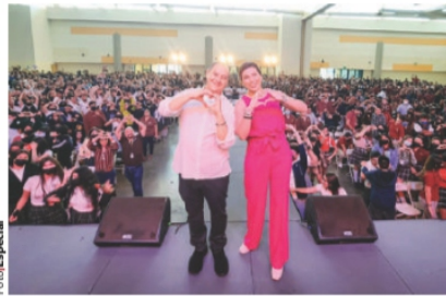
LA GOBERNADORA y el hijo de Pablo Escobar, ayer.