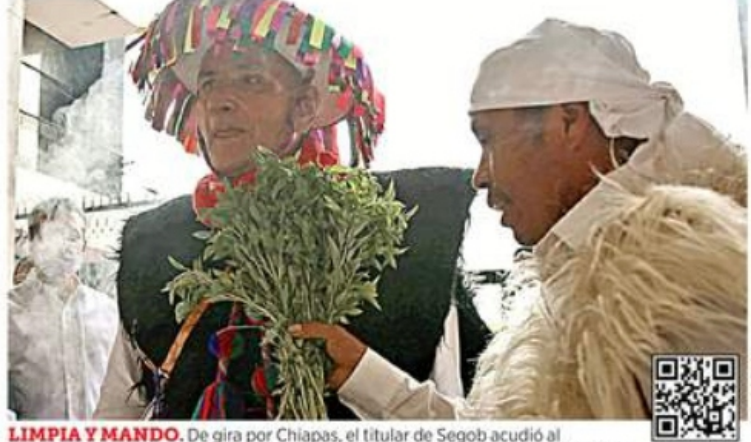
LIMPIA Y MANDO. De gira por Chiapas, el titular de Segob acudió al Congreso local; previo a su ingreso, indígenas tsotsiles de Chenalhó lo ataviaron con un traje tradicional, le dieron el bastón de mando y practicaron una "limpia".

"Adán Augusto, seréense, deje de ofender la inteligencia de la sociedad que desea contar con un sistema de seguridad. Vergüenza le debería de dar al Secretario de Gobernación ser el responsable de la delincuencia organizada tenga el control real de regiones en entidades de Morena", dijo el líder emecista. El Gobernador de Nuevo León, Samuel García, respondió a la acusación de que los elementos de la Fuerza Civil de ese estado se dedi-