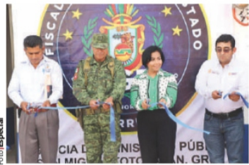
LA FISCAL de Guerrero, al inaugurar oficina del MP.