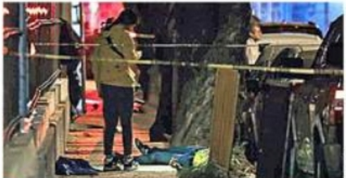
El ataque ocurrió en una calle que tiene acceso al palenque de las "Fiestas de Octubre", en el municipio de Zapopan.