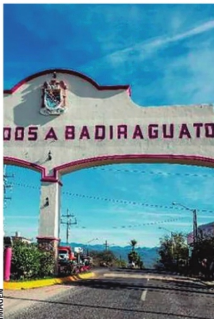
BADIRAGUATO, SINALOA ha estado durante las últimas semanas en el ojo del huracán político.

El dilema ético al cual nos enfrentamos en una situación así es si ¿verdaderamente vale la pena hacer un lugar para enaltecer a los criminales más famosos de México? Como turista lo podría afir-