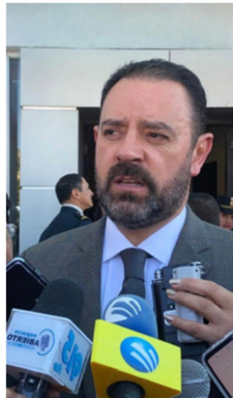
Alejandro Tello Cristerna

-JAJAJA... está buenisima la parodia, madre Teresa; el reclamo es válido, el tal ‘Alito’, hoy presidente nacional del PRI, saqueó las arcas de Campeche cuando él era gobernador, además de ser enemigo de la Cuarta Transformación, pero eso le vale una pura y dos con sal a ‘El Monris’, pues entre ellos hay muchos acuerdos infames