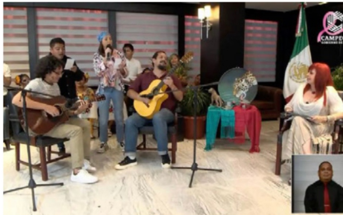
“Oye Monreal, ¿por dónde vas? por lo oscuroito no es igual”