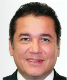
CARLOS PUENTE , DIPUTADO FEDERAL ZACATECANO

Aunque ya trascendió que en los dictámenes y anexos del próximo presupuesto, 18 estados, entre ellos, Zacatecas no tendrán un solo peso para mantenimiento o ampliación carretera; aún tenemos la esperanza de que el bloque de zacatecanos en la legislatura federal, dejen unos días sus pasiones colorinas y