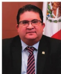
RUBÉN IBARRA, Rector de la UAZ.

El rector de la máxima casa de estudios del estado (UAZ), Rubén Ibarra, publicó el día de ayer en redes que estaba muy contento ante la "histórica participación" en la votación sobre la legitimidad de el Contrato Colectivo entre la Universidad y el sindicato SPAUAZ, y es que después de contabilidad los más