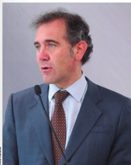
LORENZO CÓRDOVA consejero Presidente del INE.

La austeridad republicana es un proceso apenas iniciado, la resistencia a poner los pies en la tierra de una clase política que en el último medio siglo se acostumbró a ganar más que lo de sus homólogos europeos y norteamericanos, la victoria se alcanzará cuando se consolide en la mentalidad común la honrosa medianía que predicó Juárez y cultivan de manera natural muchos países del mundo.