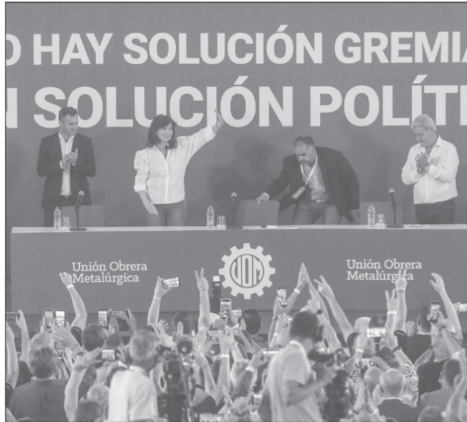
El intendente de Pilar, Federico Achával, la vicepresidenta Cristina Kirchner y el titular de la UOM, Abel Furlán

llante y conmovedor discurso de la vicepresidenta ( https://bit.ly/3E0sp3g ), dirigido a explicar la tensa situación económica y a denunciar la enorme responsabilidad en su gestación del gobierno de Mauricio Macri al contraer el mayor compromiso de un país con el Fondo Monetario Internacional (FMI) justo cuando los gobiernos kirchneristas habían cancelado la deuda con el organismo y cortado de tajo su tradicional injerencia en la economía del país austral. Cristina también habló de los escandalosos vínculos financieros y personales de personajes macristas con los autores del intento de magnicidio de que fue objeto, como de la complicidad de los jueces venales que intervienen en el caso. Sus palabras apelaron al cierre de filas y la unidad del peronismo y, sin duda, insuflaron esperanza y ánimo de lucha entre los asistentes y la militancia. Es preciso —afirmó— que los trabajadores vuelvan a participar en la política, pero no sólo en reclamo sindical, sino en el modelo de organización política del país. ■