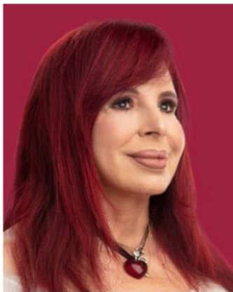
Layda Sansores San Román