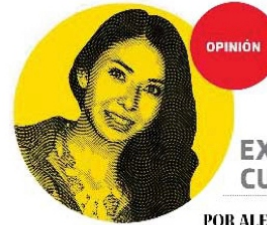
POR ALEJANDRA DE ÁVILA

Finalmente, realiza tus compras seguras por internet, verificando que el sitio cuente con el protocolo de seguridad "https:///" y un candado cerrado en la barra de direcciones. Si realizas compras en línea, verifica del comercio: la dirección, teléfonos, políticas de pago, envíos, reclamación y de privacidad de la información.