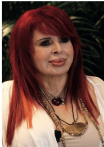
Layda Sansores San Román