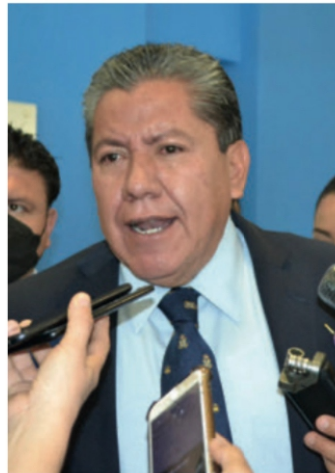
David Monreal Ávila

"EL MONRIS' con todos los peros que mucha gente le puso, hizo un buen gobierno, pues estaba en continúa actividad con la gente, principalmente con los pobres, quienes lo invitaban a comer frijoles de la olla con cebolla, jitomate y chile; el día de la Santa Cruz, que lo festejan los albañiles, se aparecía en alguna obra en construcción y se tomaba fotos con ellos con cerveza en mano echándose un 'cruzado'.