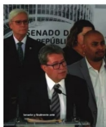
SENADORES respaldan a Ricardo Monreal

Ricardo Monreal , mostró músculo y liderazgo cuando ayer por la tarde, 88 de los 128 senadores mexicanos, manifestaron su apoyo al zacatecano y expresaron su “enérgico rechazo” a los ataques que la gobernadora de Campeche, Layda Sansores . Destacada que de esos solo 38 senadores son de Morena. Ahí nomás para que le midan.