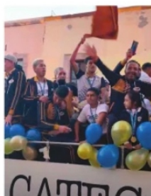
TUZOS REGRESAN A CASA, CAMPEONES.

Desde antes que los tuzos levantaran la copa de campeones muchos políticos, aspirantes, universitarios y socialites los alabaron y felicitaron por el triunfo. Pero debemos reconocer que el mérito, apoyo y compañía es de las familias, afición y amigos de los jugadores, que pese a los raquíticos apoyos de la Universidad y al nulo respaldo del Instituto de Cultura Física y el Deporte de Zacatecas, sacaron la y nos dieron una alegría en medio de tanta mala noticia. Felicitaciones Campeones.