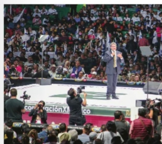
SE REALIZA primer evento de “ReconciliaciónXMéxico”

Eso sí, desde las 12:20 hubo jolgorio, animadores y música; pero además del anfitrión, la figura fue “Monri, el Indomable”, del cual se especula que es únicamente una figura dea campaña, aunque otros aseguran que en afán de promoción, será ambas cosas, luchador profesional del bando de los técnicos y a la vez personaje de precampaña de Monreal. No estaría mal que sí quisieran llegar a más público, también presentaron a un luchador rudo, pudiera ser “Monri, el Chamuco”.