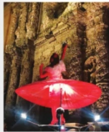
ADIOS FITC, las buenas intenciones no bastan.

La semana pasada corrió la esperanza de que por fin el recurso llegaría al IZC, pero ya no hay tiempo, ni grupos, ni planeación y en el mejor de los casos que existirá todo eso, resulta imposible ya que las principales plazas calles y espacios públicos de Zacatecas y los municipios conurbados