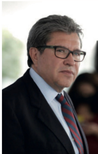
Ricardo Monreal Ávila