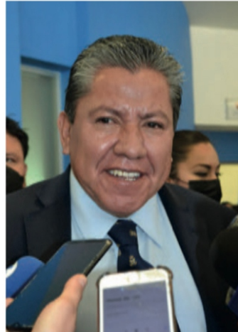
David Monreal Ávila

que pueden responder, pues comentó que es triste que no pueda abrir los tuits a las respuestas de todos porque ‘abunda gen-tuza infantil, acomplejada o idiota que se asume escribiendo en las paredes de los baños públicos y cree tener derecho a la impertinencia’.