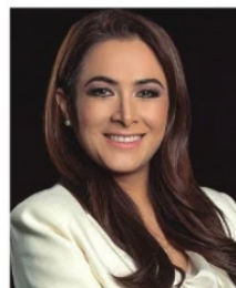
TERESA JIMÉNEZ ESQUIVEL GOBERNADORA DE "AGUAS".

El último es la cancelación del canje de placas prevista por ley para el próximo año, la gobernadora Tere Jiménez , anunció que la medida quedaba sin efectos por los tanto no hay cambio de placas y mucho menos pagos extras. Eso se llama empatía.