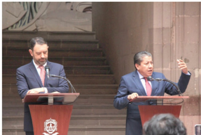
Alejandro Tello Cristerna y David Monreal Ávila