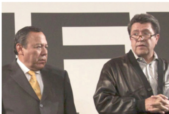
Jesús Zambrano Grijalva y Ricardo Monreal Ávila