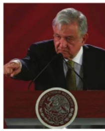
ZACATECAS CERRARÁ LA MARCHA DE AMLO

que se formaran por orden alfabético. Como comentamos y Usted bien lo sabe, a Zacatecas le tocará ser el colofón de la marcha.