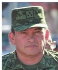
GENERAL URZÚA PADILLA HABRÍA MUERTO EN S.L.P.

Lo que sigue en el aire, es dónde falleció Urzúa Padilla , en primera instancia dijeron que, en el lugar de los hechos, luego que en un hospital de Pinos, después que en la capital zacatecana; sin embargo, Imagen tuvo acceso a fuentes del primer círculo del General Urzúa y aseguran que fue en San Luis Potosí donde el jefe de la Guardia Nacional pereció.