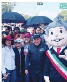
CONTINGENTE ZACATECANO PRESENTE EN LA MARCHA.

2023 o 2024, se les pidió que mostraran el músculo y poder de convocatoria a fin de ver de cuero salían más correas y quién tenían espolones para obtener nominaciones. En el caso de Zacatecas al menos 32 municipios enviaron gente a la Ciudad de México, la cifra aún está por confirmarse.