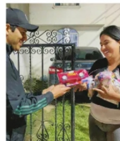
JULIO CÉSAR CHAVEZ PREFIRIÓ QUEDARSE A DARLE