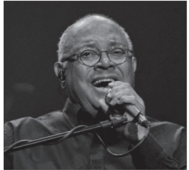
El pasado martes falleció Pablo Milanés

*Titular de la Secretaría de la Función Pública del Gobierno de Zacatecas