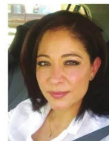
MARI CARMEN SALINAS QUIERE LEGISLAR.

Se presumió que en esta nueva asociación participan mujeres de varias entidades de la República y que en breve habrán de extender sus esfuerzos hacia Zacatecas, donde tal vez además de los objetivos planteados, generen la visibilidad y conocimiento para aspirar que “ MC ” participe en las elecciones de 2024.