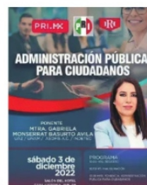
LA CONFERENCIA DEL PRI EL DÍA DEL REGISTRO.

y de no haber sorpresas, mañana sábado serán los únicos dos inscritos, aunque pronostican una competencia muy cerrada, desde lo más hondo y curtido del “partidazo”, aseguran que los dados están cargados con “Peñas” para que pesen más . ¿Será?