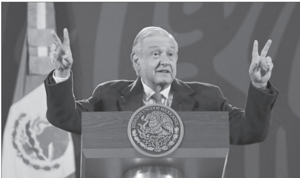
El presidente Andrés Manuel López Obrador

Es fácil deducir que los diálogos de AMLO con sus pares sudamericanos también serán un insumo para preparar su participación junto con el presidente Joseph Biden y el primer ministro Justin Trudeau, en la cumbre de América del Norte que, tentativamente, se celebrará en la Ciudad de México durante dos días de enero próximo. Será sin duda muy relevante que el presidente mexicano complemente sus propuestas anteriores con la visión y perspectivas de algunos presidentes latinoamericanos, como la del presidente Gustavo Petro, de Colombia, en materia de lucha contra el narcotráfico, o las de varios de ellos en la lucha contra el calentamiento global. Sería muy importante que AMLO convenza a sus interlocutores de la necesidad de reformar a la OEA y al BID, para que dejen de ser instrumentos para el intervencionismo. ■