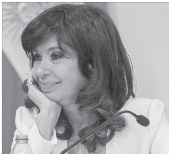
Cristina Kirchner

a acatar la ley como cualquier ciudadano. Es una realidad que en su caso hay un ensañamiento especial, pero ojo, porque también habrá consecuencias especiales por ese ensañamiento.