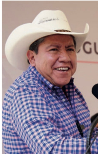
David Monreal Ávila