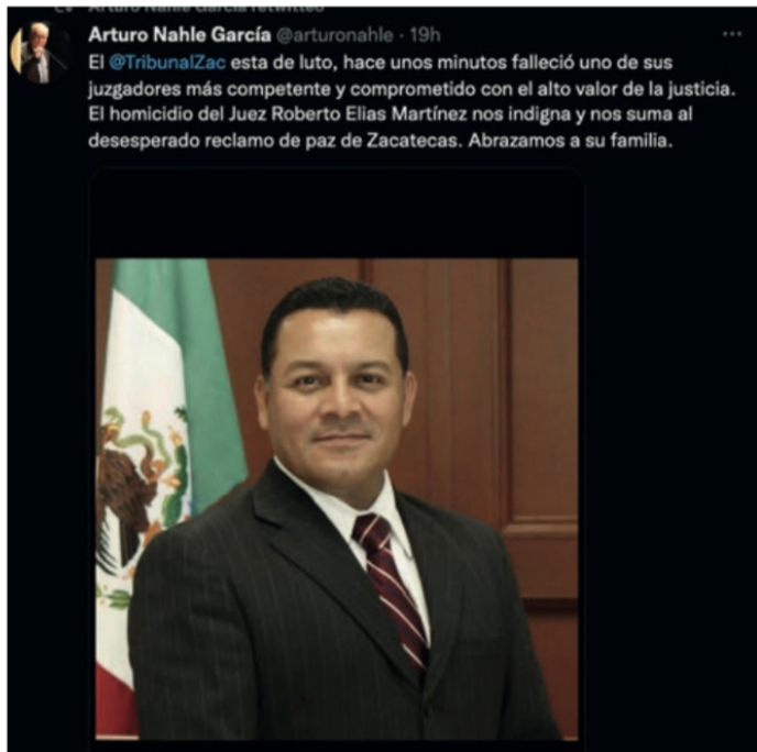
Descanse en paz

qué ‘El Rey David’ intenta pendejarnos, como si fuéramos retrasados mentales?