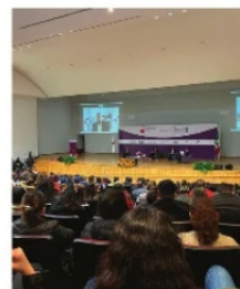
PLURAL Y ATENTOS, UNA RAYA MÁS AL TIGRE

Aún y cuando por la mañana existían vehículos “humeando”, en la zona metropolitana Zacatecas, Guadalupe, Calera, Vetagrande y Fresnillo, además de otros afectados como Jerez, Tepetongo, Colotlán, Tlaltenango, Sutcacán y Valparaíso decidieron