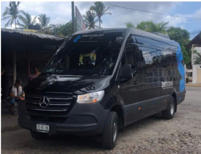
Así era la flamante camioneta Mercedes Benz