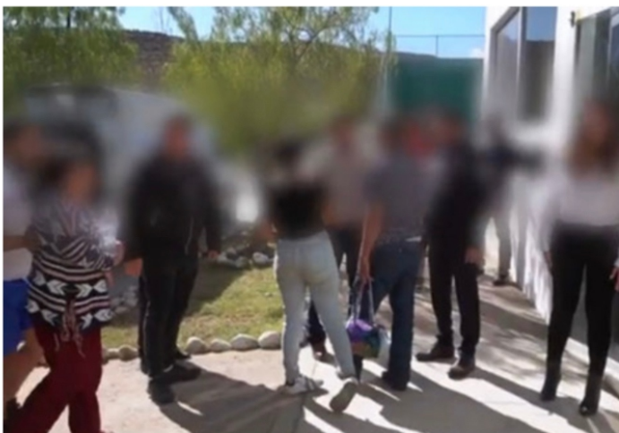
Los Aguascalentenses, rescatados por su gobierno.