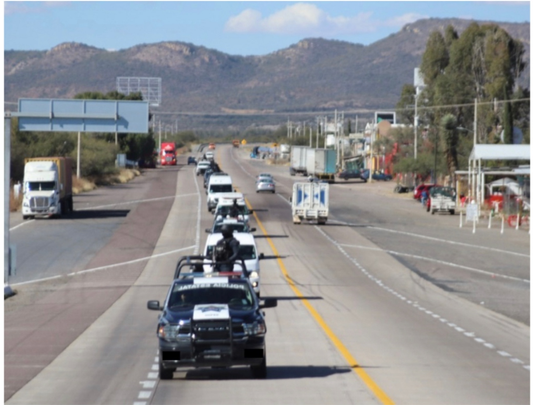
El convoy de la Policía Estatal de Aguascalientes

ASÍ, ESTA mañana del lunes 5 el funcionario estatal, encabezando un convoy se dirigió al mencionado municipio, donde el presidente municipal y el encargado de la zona militar, general Barraza, les brindó el apoyo necesario.