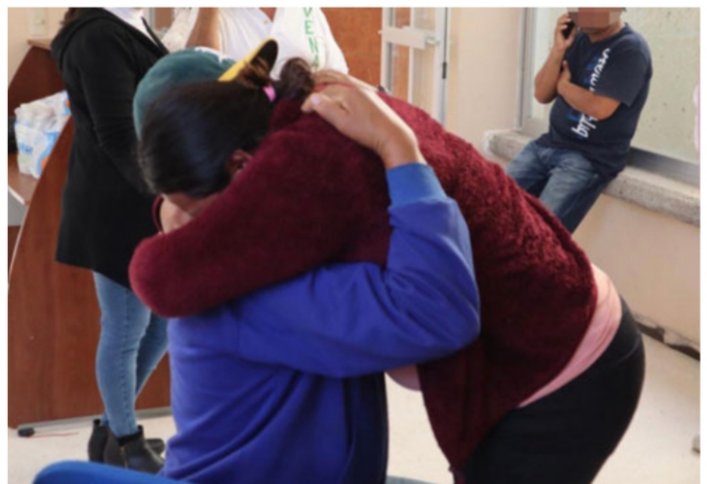
Se abrazan al término de la pesadilla