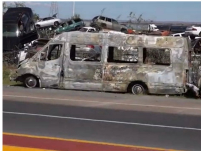
Así quedó la camioneta Mercedes Benz: totalmente calcinada