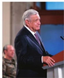
SE FORTALECEN, programas de López Obrador.

Una de las secretarías que aumentará su presupuesto si los diputados deciden no cambiarle ni una coma al presupuesto enviado será la del bienestar, se justifica el aumento porque se asignarán 100 millones de pesos para el convenio con la Federación para las pensiones de personas con discapacidad, este apartado podríamos pensar que es voluntariamente a fuerzas