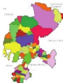
SE DESTINARÁ MÁS PRESUPUESTO A MUNICIPIOS.

Se planea que los municipios reciban más dinero en el 2023, se menciona como un presupuesto inédito ¿será que lo merecen? Si se realizará un análisis de la eficiencia con la que los gobiernos municipales gastan, ¿se podría creer que merecen ser premiados con más dinero?, quizás en algunos casos sí, pero ya mayoría gastan en fiestas y en las empresas de sus compadres, entre más lejos de la capital estén, más suceden esas prácticas.