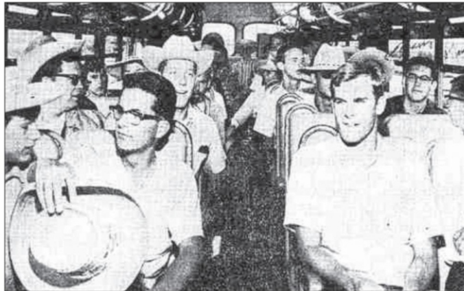
Grupo de estudiantes reclutados en San Diego para trabajar en Blythe, California, en la piscina del melón, en el verano de 1965, en una imagen publicada originalmente en el San Diego Union-Tribune

Así llegaron a Salinas varios camiones con jóvenes bullangueros y felices de pasar una aventura, los que fueron reclutados en Iowa, Kansas y Nuevo México. La prensa reseñó la