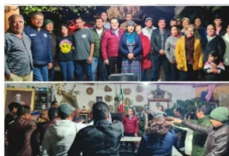
QUIEREN POSICIONAR A, CLAUDIA SHEINBAUM.

De manera muy cortés, pero directa muchos de los burócratas de la del gobierno centralizado de Zacatecas, fueron informados que por austeridad y respeto al Estado laico