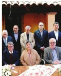
MIGUEL Y RICARDO VUELVEN A COINCIDIR.

Discreto pero acucioso el equipo de comunicación social y digital del senador Ricardo Monreal , compartieron y rolaron, una emblemática foto del zacatecano con un amplio, nutrido y poderoso grupo