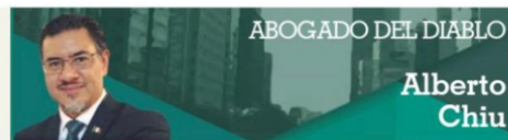
ABOGADO DEL DIABLO

Ojalá esta solicitud no represente apenas una "aspiración" social, sino que sea un faro de luz que les guíe en el camino de su trabajo, de esa altísima responsabilidad que la población ha depositado en ellos como nuestros representantes