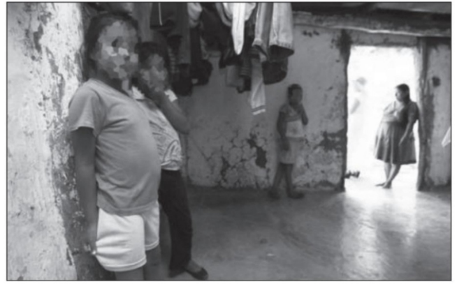
Menores de edad de una familia de escasos recursos en imagen de archivo

Por último, es necesario considerar el daño que las decisiones de Ricardo ya están haciendo en las relaciones del gobierno federal con Zacatecas en su conjunto. Es importante que todos los actores políticos que ocupan cargos en las administraciones federal y estatal, empezando por el gobernador y los diputados, fijen sus posturas con toda claridad, antes de que el deterioro se vuelva irreversible. Es necesario que no dejen lugar a ninguna duda sobre su lealtad a la 4ª T, a Morena y al presidente. Ello también es indispensable para que la dirigencia nacional de Morena pueda determinar los posicionamientos políticos y las líneas de reorganización que, sin duda, son muy urgentes para evitar mayores daños al pueblo de Zacatecas. Es fundamental crear las mejores relaciones políticas para ver si se logra que algunas empresas, de las que están anunciando sus inversiones en México, puedan hacerlo en nuestra entidad. Ojalá que no nos ocurra lo mismo que cuando inició el TLCAN. ■