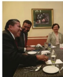
EL GOBERNADOR CON LOS LÍDERES PRIVADOS.

Y no es que no le quieran o le vayan a pedir las perlas de la Virgen, se trata solamente de que los escuchen y que quien encamine el destino económico de Zacatecas sea afable, conducente y atento para enderezar la relación, procurando que a todos, todos nos vaya bien.