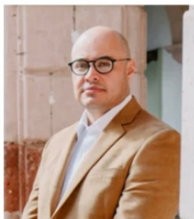
FRANCISCO MURILLO, por fin salió de donde andaba

Los honores a la bandera, los actos cívicos, no han hecho mella ni reforzado la seguridad en Zacatecas, a pesar de que el Gobernador puntualmente, cada lunes realiza el acto cívico de alabanzas al lábaro patrio, estas acciones no detienen y ni remotamente, contienen la inseguridad en nuestro estado. Ayer, en un hecho inédito, el Fiscal General de justicia de Zacatecas, Francisco Murillo dió la cara y anunció públicamente el hallazgo del vehículo en el que viajaban los cinco jóvenes zacatecanos que buscaban llegar a Colotlán, el vehículo y un cuerpo fueron ubicados en el "Cuidado" Tepeteongo junto a otros "hallazgos" de restos humanos. Es increíble que estos cuerpos y evidencias pasarán casi tres semanas sin noticia ni reporte. Entre los habitantes de a zona se decía que la camioneta solía circular por las calles de vez en cuando pero que nadie hacía nada ni pasaba nada, hasta 3 semanas después.