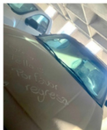
LOS "DESTELLOS" ¿Siguen las pintas?