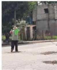
EFICIENTES TAPABACHES, DOS HACEN LO QUE SEIS.

En las últimas semanas han aparecido en varios municipios de la entidad: como Zacatecas, Guadalupe, Jerez, Fresnillo y Villanueva , un par de hombres, que ya son conocidos como los “tapabaches”, estas personas trabajaban en una empresa constructora y generadora de asfalto para carreteras, gracias a la reducción en la inversión de obra pública, fueron despedidos y ahora se autoemplean tapando baches, grietas y aligerando la altura de los topes en estos municipios, lo hacen a cambio de la propina que los automovilistas voluntariamente les otorgan.