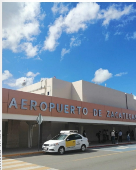
AEROLÍNEAS EN ZACATECAS son subsidiadas por el Gobierno del Estado con compra de boletos.