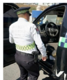
QUE TRANSITO PONGA EJEMPLO

Todos querían acercarse o saludar al nuevo secretario y así fue aún no acababa el acto cuando ya estaban listos para la foto y la presentación, el teléfono del nuevo secretario que se suponía era casi secreto empezó a recibir mensajes de felicitación y llamadas de auxilio, en los próximos días habrá de tener encuentros con distintos grupos políticos y sociales a fin de confirmar o replantear la estrategia en Zacatecas . Que así sea.