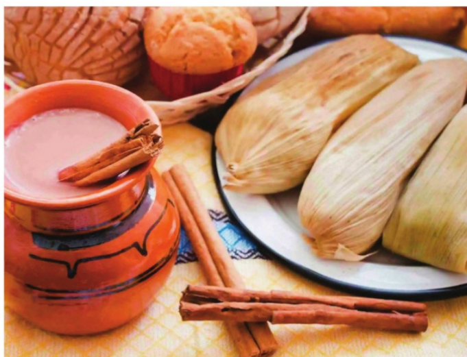
EN LA TRADICIÓN MEXICANA se acostunbra comer tamales el día de la candelaria.

Según historiadores y sociólogos, el festejo del día de la Candelaria en nuestro país es un sincretismo entre las culturas prehispánica, católica y judía que se ha venido modificando con el correr