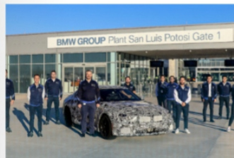
BMW INVIERTE 700 MILLONES DE EUROS EN SAN LUIS,

Mientras en Zacatecas dedican la agenda de un día y la información oficial de dos a celebrar la apertura de una tienda Elektra, nuestro vecino San Luis Potosí , pone la muestra y con la misma alaraca anuncian la apertura de una planta automotriz de BMW con una inversión de más de 700 millones de euros. No importa, en la semana celebraremos en Zacatecas la apertura de otro merendero