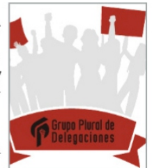
GRUPO PLURAL DE DELEGACIONES UAZ, SI PERO NO.

Ibarra , la falta de entendimiento para entablar un diálogo y la ignorancia a los planteamientos emitidos por el comité de huelga de la Universidad . Al mismo tiempo se deslindan de los paros en preparatorias (ese es otro cantar), tiene otros intereses, otros beneficiarios y desde luego otros líderes.