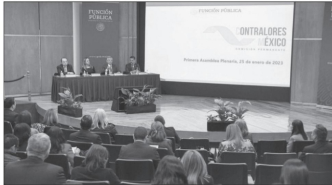
Comisión Permanente de Contralores Estados-Federación realiza su primera Asamblea Plenaria 2023

trasciendan como política nacional en materia de control interno, contrataciones públicas, evaluación a Órganos Internos de Control (OIC), responsabilidades administrativas y jurídico consultivo, ética y combate a la corrupción, fortalecimiento y criterios, a través de testigos sociales y asuntos nacionales e internacionales; de esta