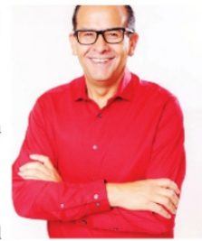
NI AMBULANTES HUBO, CARAY

Padres de familia, personal, docente y de apoyo de la escuela Ignacio Zaragoza en Jerez anunciaron públicamente que no participarán en los festejos del Carnaval de Jerez, 2023 , esto en solidaridad con el gremio musical del cual al cual pertenece muchos exalumnos y muchos hijos y parientes de los músicos jerezanos.