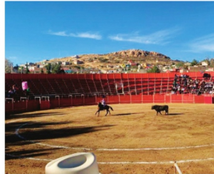
PLAZA SOLA NI LO QUE GASTARON EN GASOLINA Y CHEVES

Se recordó que sí bien, es cierto que las plazas de