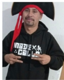
LO QUE FALTABA: EL MEDIO METRO,

Otra vez en quedado solas las Unidades Regionales de Seguridad " UNIRSE ", luego de que se hiciera público el abandono pleno de las unidades preventivas, el anterior secretario de Seguridad Pública mandó patrullas desvencijadas solamente como ornato para generar imagen de resguardo, después elementos de la Guardia Nacional estuvieron a cargo de estos centros en las Arcinas y en Malpaso, pero desde el lunes nuevamente se encuentran en pleno abandono y ya ni las patrullas chatarra dejaron, dice el secretario que llegarán renovadas y recargadas.