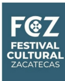
POR ALGO SE EMPIEZA, "NUEVO" LOGO DEL FCZ

A 40 días de que se inaugura el Festival Cultural, apareció el logo, que es prácticamente el mismo del del año pasado, no se define temática y mucho menos algún programa o ancla que pueda levantar un poco el caído turismo zacatecano. Pero logotipo ya hay.