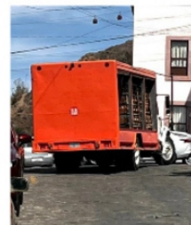
YA CIERRAN CALLES A LA HORA QUE QUIEREN

Cuando se trazó y habitó el centro histórico de Zacatecas, por la época fue pensado para peatones y vehículos movidos semovientes, las calles estrechas, la subidas extremas dificultan el paso y tránsito de vehículos de carga, por eso es común que los tractocamiones repartidores de empresas cerveceras, refresqueras o de agua purificada como Bonafont continuamente se vean inmiscuidos