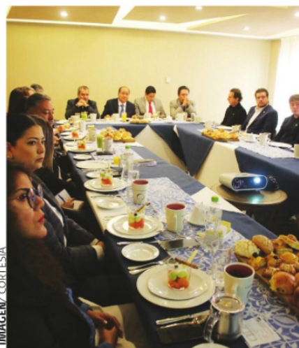
SE REUNEN EMPRESARIOS TURÍSTICOS CON SECRETARIO DE TURISMO para plantear proyectos en pro del turismo.

Como empresarios aparte de sobrevivir, tene-