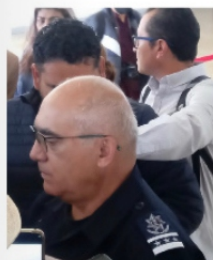
EL GENERAL MAYORAL SE PREOCUPA POR SU TROPA