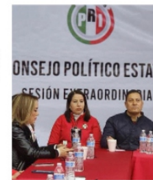
¿ENTONCES QUIÉN MANDA?