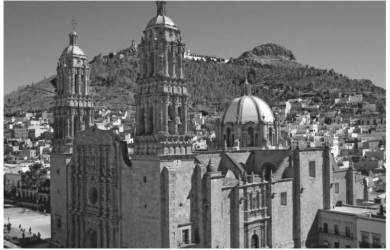
Entre febrero y junio de 1823 se dio un proceso revolucionario desde las provincias. En esos meses, pasaron de ser autónomas a ser soberanas; algunas, como Zacatecas, se declararon entidades libres. En la imagen, centro de la ciudad

Como es sabido, en el negocio de los medios de comunicación se paga más por lo que se calla, que por lo que se dice. Y probablemente nos falte mucho por saber. ■