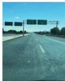
QUE EL SANTO NIÑO PROTEJA LAS CARRETERAS

El único cambio es que si ya hay un policía para las salidas y otro para las entradas en la UNIRSE de Trancoso. Eso si pasando a territorio potosino se empieza a ver de vez en cuando una que otra patrulla de la Guardia Nacional.