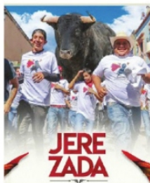
LA PEÑA SE DESPEÑA, UNA PENA, AJENA

Después de la decisión del ayuntamiento jerezano de celebrar los festejos únicamente con el respaldo de los empresarios taurinos, la Peña Taurina habrá de tener sesión para decidir si avanzan, si la disuelven o se crea otra peña taurina con los inconformes.