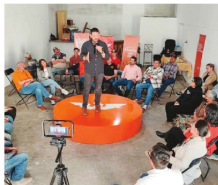
MOVIMIENTO NARANJA, CON POCA FRANJA