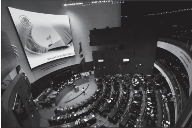
El Senado de la República ha dado muestras de responsabilidad y apertura, al despresurizar la aprobación del Plan B, señala el colaborador