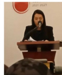
PRESENTAN A MEDIAS PROGRAMA A MEDIOS

Quién iba a pensar que en la presentación de el festival la participación más importante y esperada iba a ser la del Secretario de Seguridad, todos los asistentes querían saber cual era el plan para proteger a los turistas valientes que quisieran venir a Zacatecas a pasearse pese a que todo el país piensa que esta es zona de guerra.