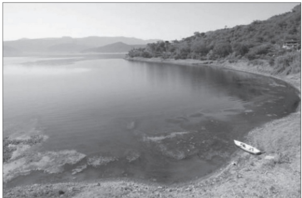
En el sexto Congreso Bienal en La Laguna, del 14 al 16 de octubre de 2022, con más de medio millón de asistentes, se buscaron alternativas en la gestión del agua dentro de las cuencas, sin megaobras ■ FOTO: LA JORNADA

—Tenemos un antecedente histórico terrible. En la invasión española, los líderes eran extremeños, de zonas desérticas y tenían fobia al agua; todo el ataque a Tenochtitlan se hizo desde bergantines. Por tanto, rompieron el sistema lacustre, los diques, el albaradón de Nezahualcóyotl que separaba las aguas dulces de las saladas en la cuenca. Así, en 1607 empezó el proceso de drenado. Enrico Martínez fue el primero, en Huehuetoca, que drenó las aguas del Valle de México que Humboldt rescató a principios del siglo XIX, ‘Qué extraños los novohispanos que odian el agua’, exclamó. Se opuso a una tradición muy profunda, milenaria de las comunidades que todavía subsisten, porque la Conquista destruyó todo’. ■