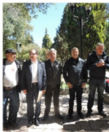
REFORESTAN CUIDADANOS JARDIN EN JEREZ

Ayer el secretario general de gobierno de Jerez anunció que un par de personas intentaron prender fuego a la presidencia de este pueblo mágico, sin duda a noticia alarmó a los jerezanos y a los zacatecanos que le tienen cariño a Jerez, queda claro que todavía hay mucho trabajo por hacer para lograr la tranquilidad de Jerez, también anunció que el presidente ya anda gestionando ayuda con distintas fuerzas policíacas para que lo apoyen en el día a día y en los eventos especiales como la jerezada que ya está aquí. Por otro lado los jerezanos siguen demostrando el amor por su pueblo, un grupo de empresarios hicieron nuna colecta con la intención de reforestar el jardín principal. ellos decidieron