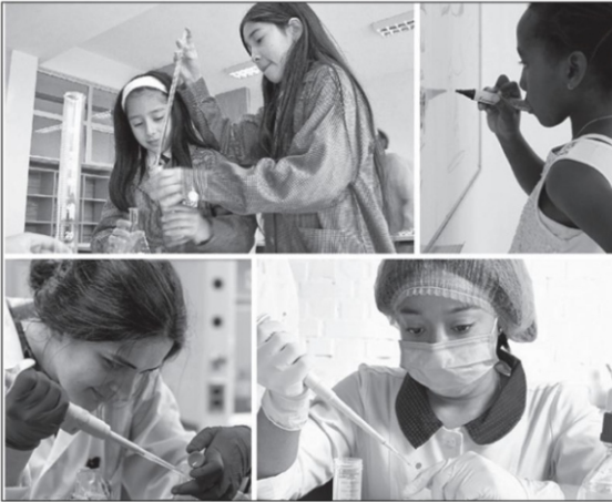
El 11 de febrero se conmemoró el Día Internacional de la Mujer y la Niña en la Ciencia .