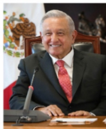
¿SERÁ QUE LE DEBEMOS EL CAMBIO DE ESTRATEGIA A AMLO?

En una de esas el cambio de estrategia se lo debemos a el mismísimo López Obrador pues el 19 de octubre del 2021, en su conferencia matutina el propio presidente reconoció que él solicitó a los gobernadores cuidar los perfiles de los encargados de la seguridad pública y que para ello, los validarán con los titulares de las Fuerzas Armadas. también dijo que: "Los propios gobernadores están solicitando a la federación que sea ésta la que nombre a los que van a desempeñar las funciones de secretarios de seguridad pública porque a nivel local no confían en los cuadros". Medina Mayoral ha mencionado de una de las mejores formas de combatir la delincuencia es con tecnología y ha dicho que en los próximos días se estará presentando una aplicación por la cual la sociedad podrá solicitar apoyo en una situación de riesgo, además de brindar apoyo para denuncias. Quizás sea algo similar a lo que tienen nuestros vecinos de Aguascalientes con su app C5 Ags , mediante ella pueden solicitar de manera inmediata el apoyo de Policías, Bomberos o Paramé-