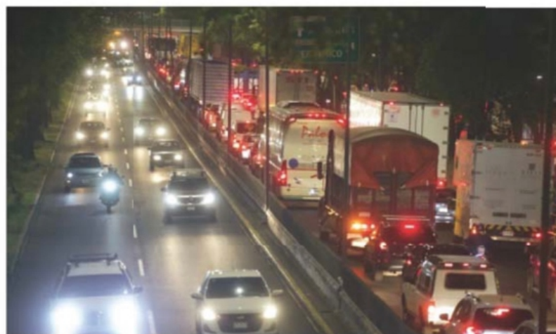
GERMAN ESPINOSA, EL UNIVERSAL