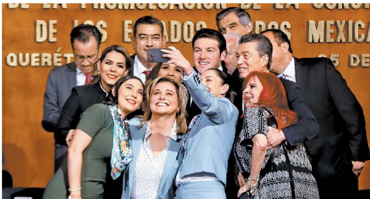
Claudia Sheinbaum organizó la selfi entre gobernadores asistentes a la ceremonia.