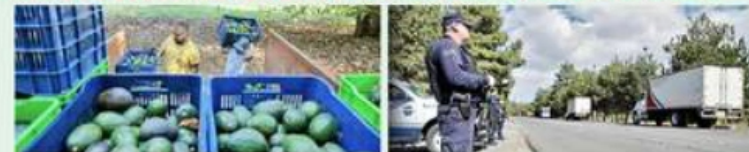
En pueblos como Santa Ana Zirosto, Michoacán, se deben armar convoyes con resguardo policiaco para sacar cargamentos de aguacate valuados en hasta 100 mil dólares.

El llamado "oro verde" debe cruzar carreteras acosadas por cárteles del narco, b