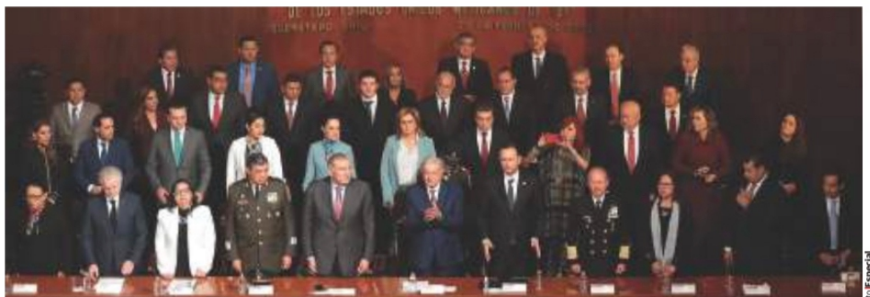
EL PRESIDENTE, los representantes de los poderes Judicial y Legislativo y los gobernadores del país, ayer, en Querétaro.

" EL HUMANISMO mexicano expresado por el Ejecutivo es un concepto válido, sustentado en la razón jurídica y en la esencia de estas modificaciones (constitucionales) que hemos hecho a favor de los mexicanos" Alejandro Armenta Presidente del Senado de la República