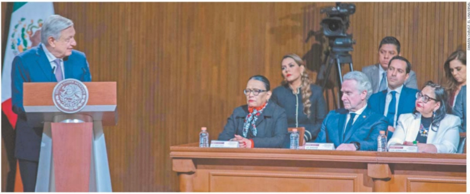
El presidente Andrés Manuel López Obrador ayer en su participación en la ceremonia; lo escuchan, entre otros, Santiago Creel y Norma Piña.