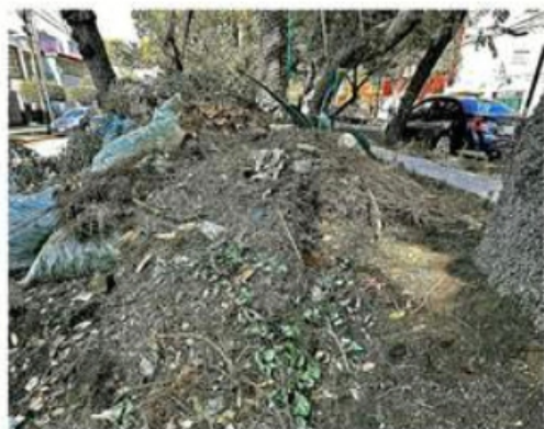
Estado de una de las obras modificadas por la Alcaldía.

La Sedena también apuesta por 15 camionetas SUV con blindaje Nivel V Plus, el cual soporta ataques con fusiles de asalto calibre 7.62, por un costo de entre 50 y 55 millones de pesos.