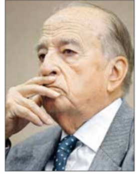
▲ Fue maestro forjador de conciencias críticas, dicen en carta con motivo del 101 aniversario del ex rector de la UNAM. Foto C. Rodríguez / P 7

Compañeros de lucha y amigos rinden tributo a don Pablo