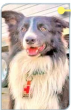
ORLY (HIJO) ESTÁ ACTIVO La Cruz Roja Mexicana lo adiestró en búsqueda y rescate en estructuras colapsadas.