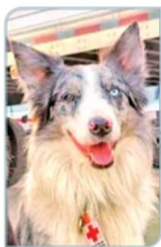
BALAM (HIJO) ESTÁ ACTIVO Junto con su hermano ha rescatado a tres personas con vida y ha recuperado 11 cadáveres.