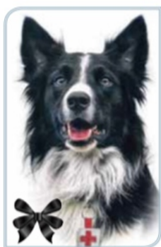
ATHOS (PAPÁ) ENVENENADO EN 2021 Participó en las labores de rescate tras el sismo del 19 de septiembre de 2017 en la CDMX.

Orly y Balam son dos perros rescatistas de la Cruz Roja Mexicana enviados a Turquía para continuar con la misión de su padre, Athos, otro perro de la institución que murió envenenado en junio de 2021. Ayer, Balam ayudó a sacar de los escombros a una persona de entre 35 y 40 años. Junto con su hermano (abajo) ha recuperado 11 cuerpos en la ciudad de Adiyaman. / 20