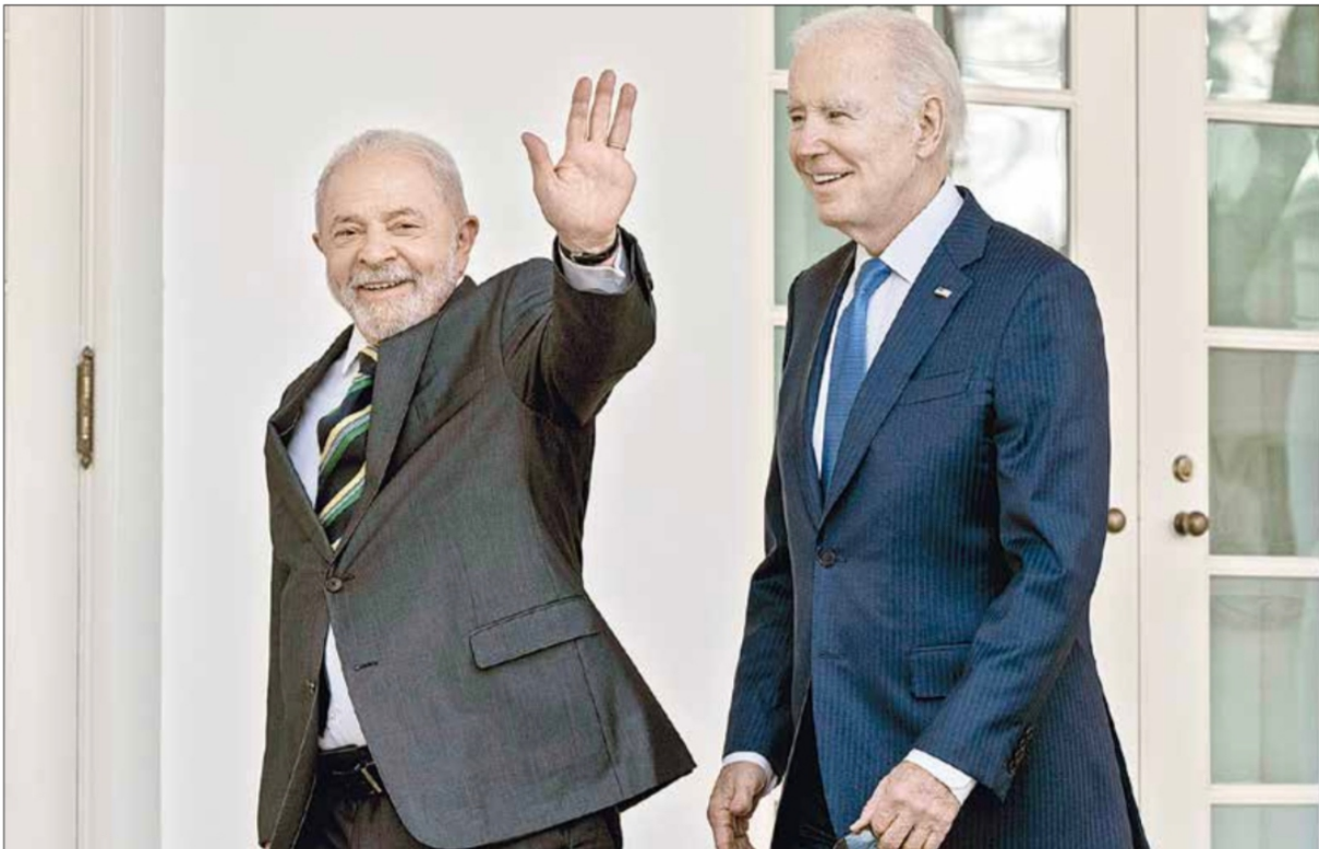
▲ Las democracias de Estados Unidos y Brasil, “las más grandes del hemisferio occidental, han sido duramente probadas”, dijo el mandatario estadounidense a su par Luiz Inácio Lula da Silva, durante su visita a la

Biden y Lula, “en sintonía frente a los retos globales”