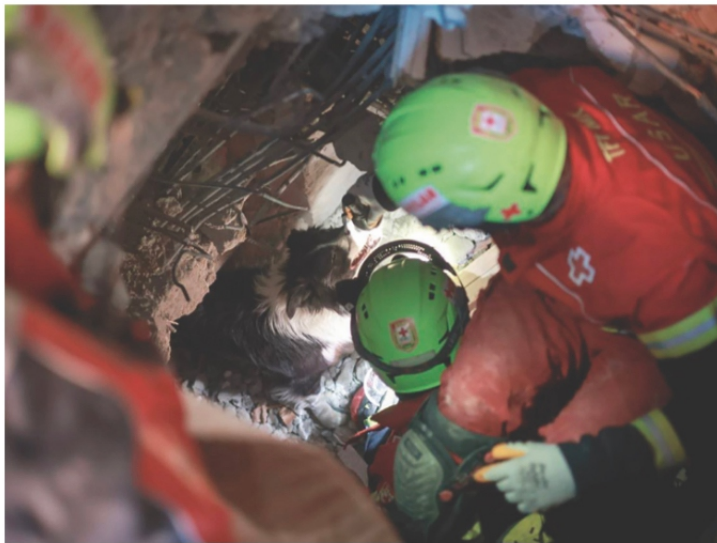
ELEMENTOS de la Cruz Roja Mexicana, ayer, con su binomio canino en un rescate.

BALAM , un border collie, ayudó a salvar a una persona; éste heredó de su padre Athos, genes de rescatista; suman 23,700 decesos