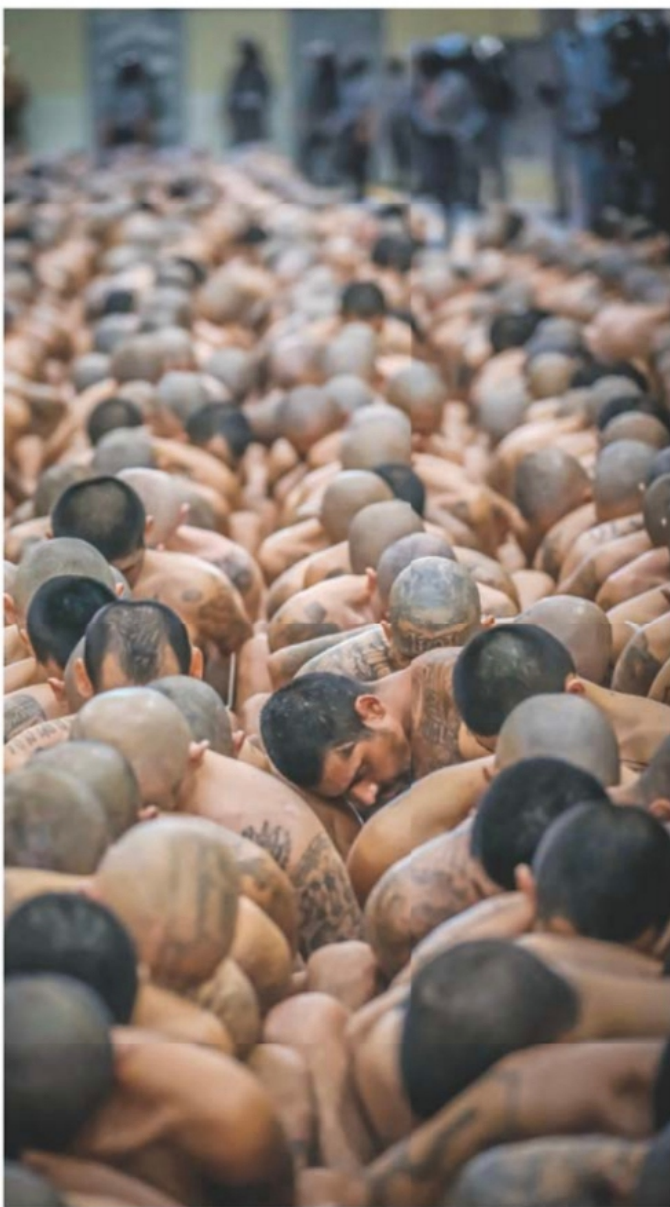
IMAGEN DEL DÍA | 2 MIL, A MEGACÁRCEL