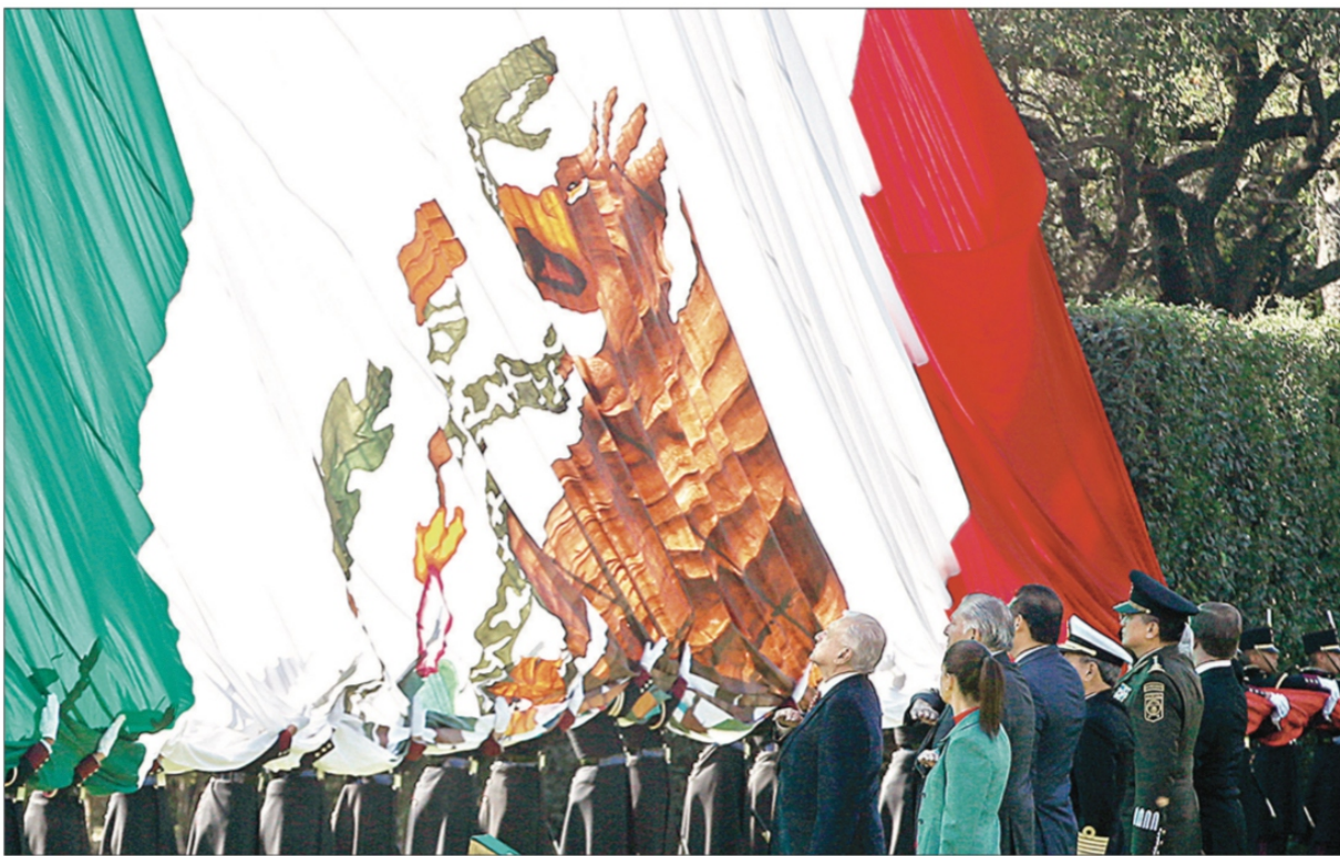
▲ En el Día de la Bandera, el presidente Andrés Manuel López Obrador recordó que el lábaro patrio ha sobrevivido a muchos intentos por modificar su composición, “como cuando en un sexenio reciente se mutiló el Escudo, lo que se conoció como ‘águila mocha’. Al margen de la pertenencia a diferentes grupos políticos y sociales, ha sido

“Historia de la Bandera, ligada a la lucha por la libertad”