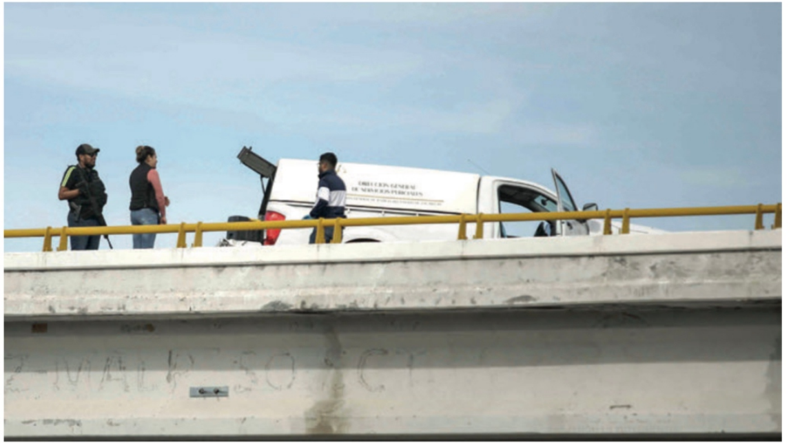
El cuerpo de un hombre sin vida fue localizado sobre un puente vehicular en el municipio de Malpaso

* Aquí Jerez: Ejecutan a dos y los Arrojan en La Ciénaga; Guadalupe: Narcos Matan a Hombre y Hieren a Otro