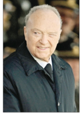
▲ El fiscal general acudió a la ceremonia por el Día de la Bandera. “Goza de buena salud”, celebró el Presidente. Foto Afp A. SÁNCHEZ Y L. POY / P 3

Exoneran a Rosario Robles; fiscalía general apelará el fallo