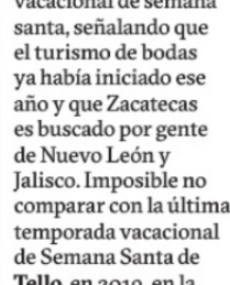
TURISMO espera 40% de ocupación hotelera.

vacacional de semana santa, señalando que el turismo de bodas ya había iniciado ese año y que Zacatecas es buscado por gente de Nuevo León y Jalisco. Imposible no comparar con la última temporada vacacional de Semana Santa de Tello, en 2019, en la cual se anunció una ocupación hotelera del