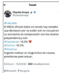
CLAUDIA ANAYA, busca especialista para analisis.

Si alguno de ustedes es especialista en temas diagnósticos económicos comuníquese urgentemente con la senadora Claudia Anaya , esta interesa en realizar un diagnóstico lo más pronto posible de por qué Zacatecas no logra recuperar los noveles de economía que tenía antes de la pandemia. A través de un tweet publicó la necesidad de ese estudio, seguramente planea un proyecto desde el senado para apoyar a Zacatecas y sacarnos de la crisis. Interesados mandenle mensaje directo por twitter.