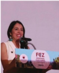
IZC presenta prometedor programa del fcz 2023.