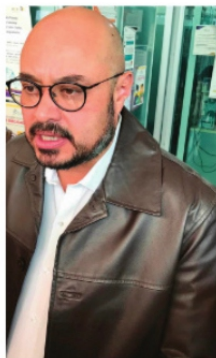
FISCALIA VINCULA A 2 POR VIOLENCIA DEL 8M

das en flagrancia durante la marcha del pasado ocho de Marzo, fueron vinculadas a proceso por la Fiscalía General de justicia, confirmó Francisco Murillo Ruiseco , quien detalló las ingresaron al Sistema de Justicia para Adolescentes, ya que portaban uno de los escudos con los que las policías resguardaban los edificios.