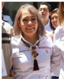
VILLALPALDO, cada vez más cerca del juicio político.

Ante los razonamientos mostrados por los legisladores por el desacato cometido durante la glosa del primer informe de gobierno, la secretaria de educación enfrentará la eventual posibilidad del juicio político y la posibilidad de que de aprobarse, sería destituida.