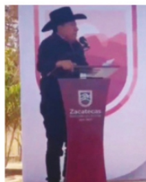
EL GOBERNADOR, acusó a los diputados de no trabajar,

con los diputados; pero se equivocó el mandatario, ya que a la secretaria se le inicia juicio político no porque haya faltado a una plática de cuates con los diputados, su falta fue tomar a la ligera la Constitución, la cual obliga a los secretarios de estado a comparecer para la glosa del informe. En el peor momento y en la peor circunstancia, quedó claro, otra vez, que el gobernador de Zacatecas no tiene a nadie que le ayude en la operación política, y otra vez le toca a él sólo apagar los incendios de otros, dejando la ventana abierta para que haga crisis el gobierno (más).