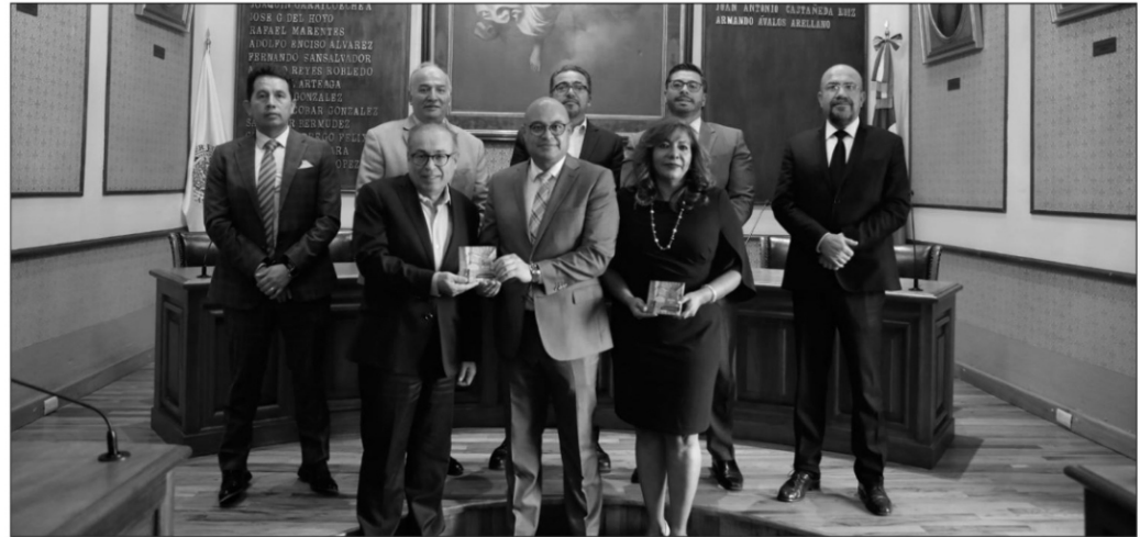
El fiscal acompañado de los magistrados integrantes de las Salas Penales, así como del magistrado presidente, Arturo Nahle García

De igual manera, Nahle García celebró el incremento de judicializaciones que ha llevado a cabo la Fiscalía General de Justicia, y enfatizó en que no sólo debe reforzarse el combate a