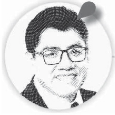
Saúl Monreal Ávila