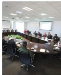
HOY ES VIERNES DE "REGAÑO DE GABINETE"

La directora de Cultura, prefiero sus gustos personales que los del pueblo zacatecano, a quien se debe, al dejar ir una cartelera internacional para el Festival cultural que inicia mañana, ya que al no ser artistas de su preferencia, decidió no contratar a la agrupación Scorpions , banda alemana de hard rock y heavy metal fundada en Hannover en 1965, y que por estas fechas anda de gira por México. Tampoco quiso contratar al cantante colombiano Sebastián Yatra , quien hoy estará en el parque fundidora de Monterrey, su decisión fue no contratar a esos internacionales que no son dignos de un festival de cultura como el de Zacatecas. Seguro habrá más regaños, ya veremos con que cara salen los secretarios. Medina Mayoral podría salir sonriendo y con estrellita en la frente porque por primera vez desde que comenzó la administración de David Monreal hubo reacción inmediata para contener la crisis provocada por los grupos criminales.