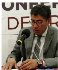
SAÚL MONREAL, sufre accidente automovilístico.

De deseamos al alcalde pronta recuperación.